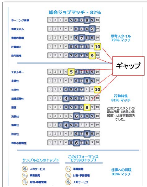
ある人材と「理想の人材像」とをマッチングさせたデータ（適合している項目は青色、ギャップは黄色で示される）